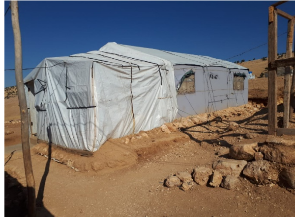
Flüchtlingslager in Sinjar