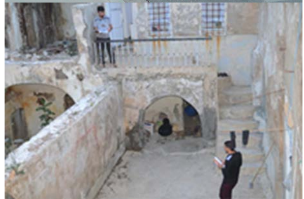
Lernen im Lager, auf der Straße oder in Ruinen