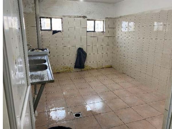
Küche im Wohnheim für Studentinnen