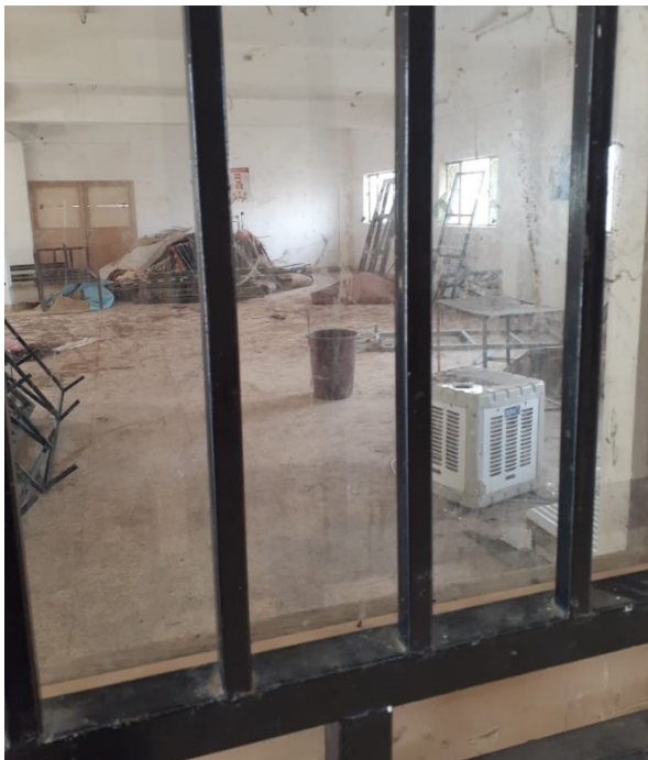
Abstellraum vor ...