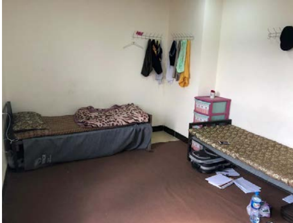
Mehrbettzimmer und ...

DhK wurde von den Studierenden gebeten, die Lebens- und Studienbedingungen an der Universität Dohuk konkret zu verbessern. Insbesondere die Studierendenwohnheime auf dem Campus sind in sehr schlechtem Zustand. 2-3 Personen teilen sich ein kleines Zimmer, oft fehlt Platz für Tisch und Stuhl; 50 Personen teilen sich eine Küche (bestehend aus 2 Herdplatten und 2 Waschbecken) und 4 Toiletten. Die Wohnheime für Studentinnen werden um 17 Uhr geschlossen, obwohl Aufenthaltsräume fehlen.